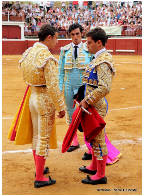
Cérémonie de l'alternative