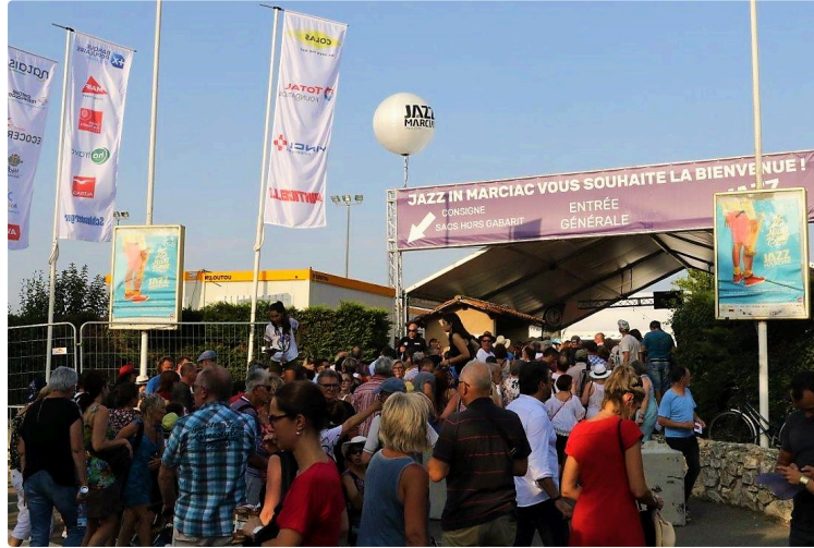
Jazz in Marciac - Le temps du final