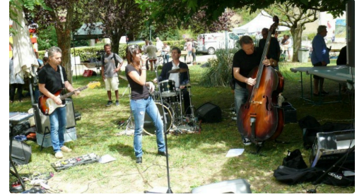
L'orchestre Blue Berry anima la journée.