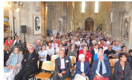
Le public attentif et enchanté par le spectacle