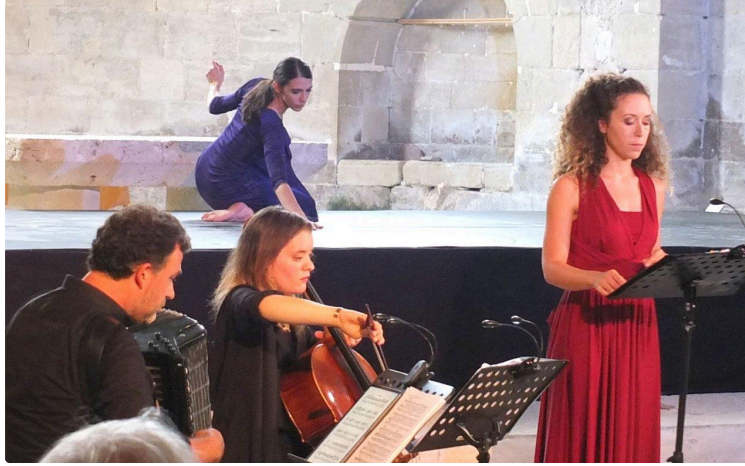
Danse sacrée et musique de Bach

Au final, un spectacle enchanteur qui a suscité l'enthousiasme du public