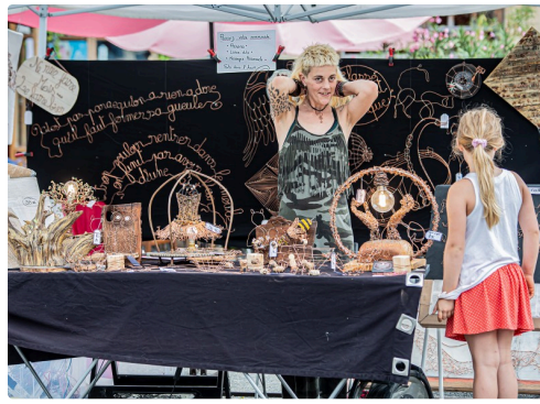
Tout faire avec du fil de cuivre