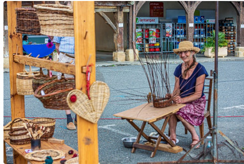
La vannière et ses produits