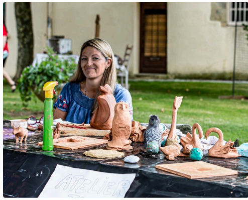
Atelier "terre" pour les enfants