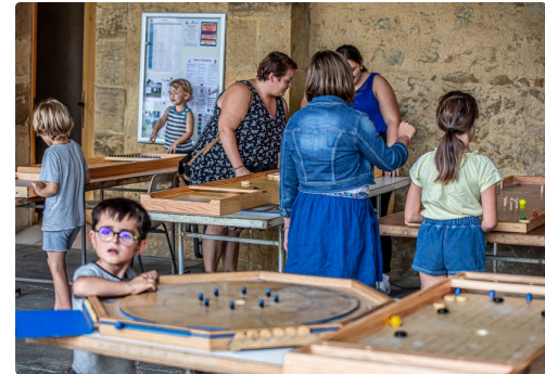
Les jeux en bois n'intéressent pas que les enfants