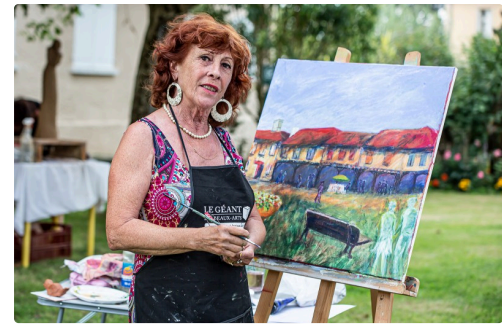
Une dame peintre en action