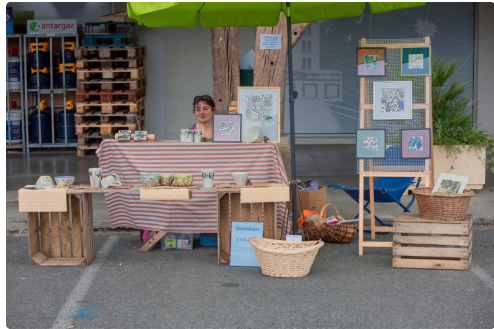
Peintures sur objets