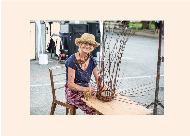
Artistes dans la rue à Aignan