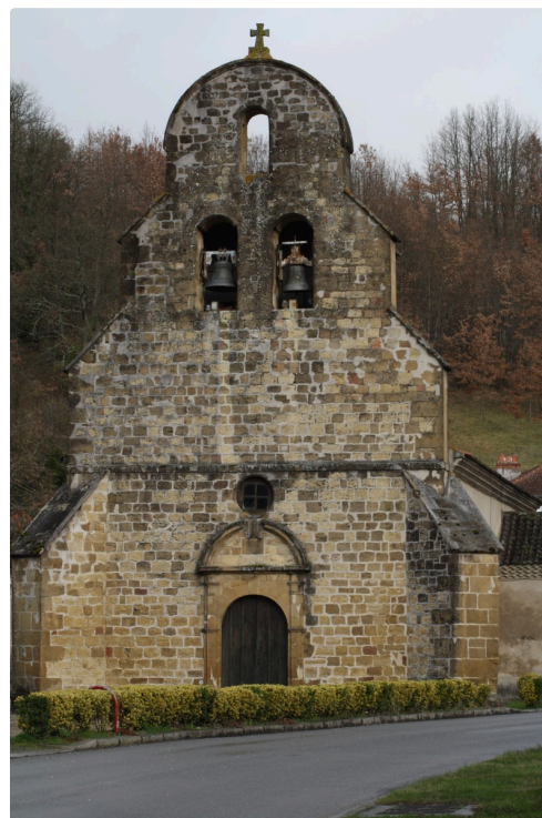
Betplan, l'église Saint Laurent.