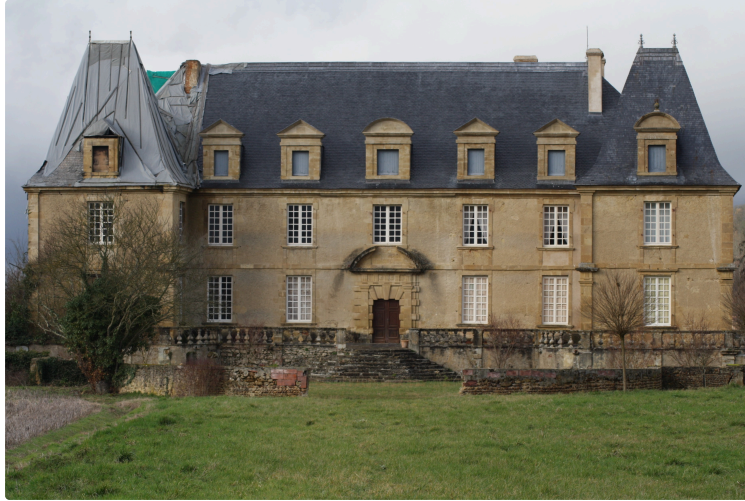
Six siècles d'histoire locale