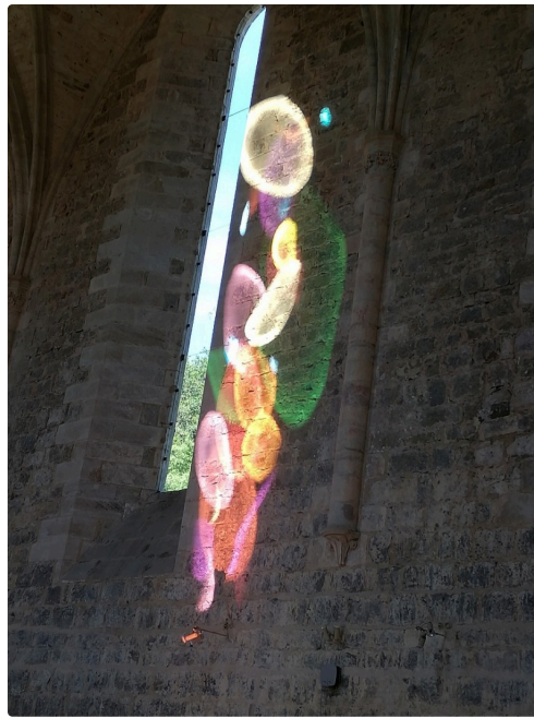
La magie opère : une vierge et l'enfant ?