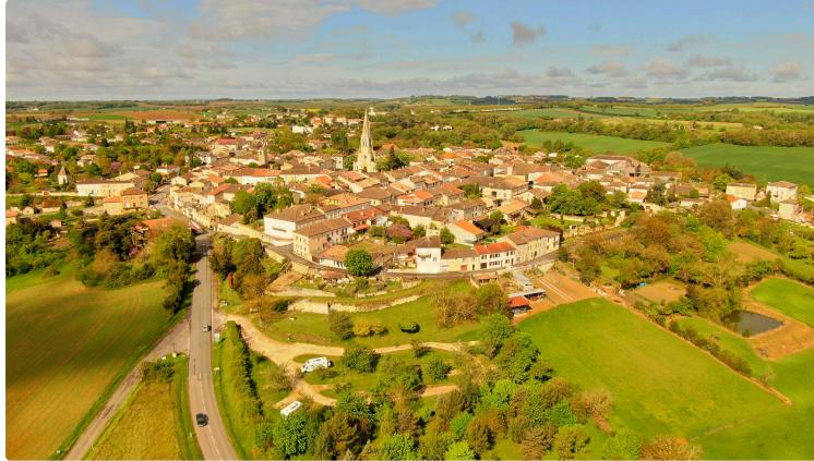
L'ACLED mène l'enquête !

Samedi 24 août, à 21 h , l'Association Culture et Loisirs de l'Espace Dastros (ACLED) convie, samedi prochain, à son quatrième concert de l'été, à la Vieille Église de Saint-Clar, pour un spectacle musical très enchanté.