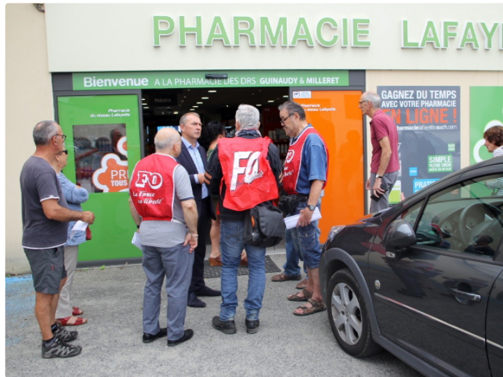
La guerre des pharmacies relancée

Quatre pharmaciens s'élèvent de nouveau contre la pharmacie Lafayette