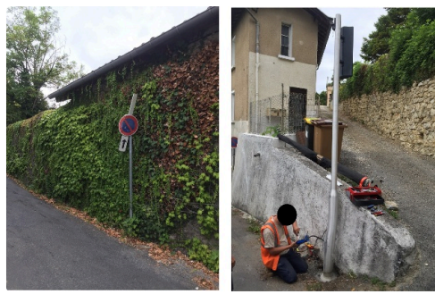
Ça passe juste ! Et seulement dans un sens !