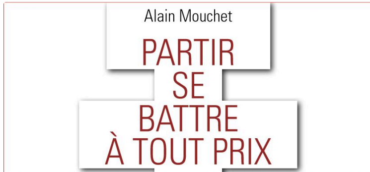
"Partir se battre à tout prix" Alain Mouchet.