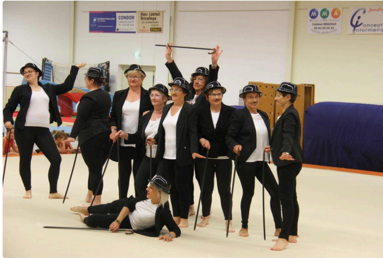
C'est la reprise aussi pour la Gymnastique Volontaire

Les cours de la section de Gymnastique Volontaire à la Municipale Gymnique Condomoise reprendront le mardi 3 septembre , à 9 h 15, au gymnase Jean Dubos-René Lécina.