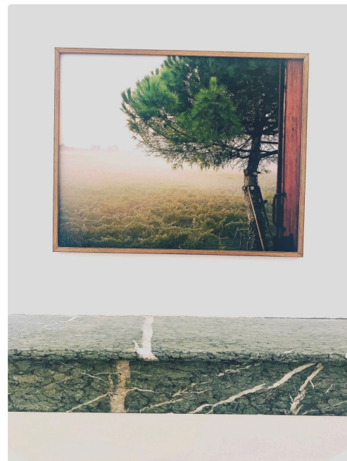
Maitexu Etcheverria, voyage insulaire, 2016