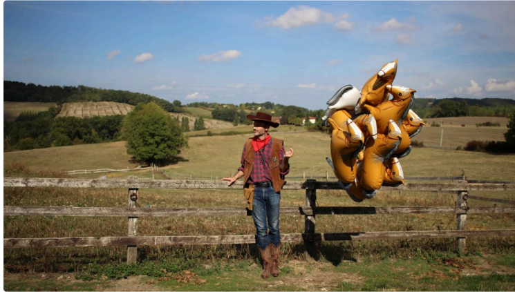
L'Été Photographique. Une belle profondeur des champs

Loin des clichés, des photos de vacances ou des cartes postales, l'Été Photographique est le rendez-vous gersois incontournable des amateurs d'images.