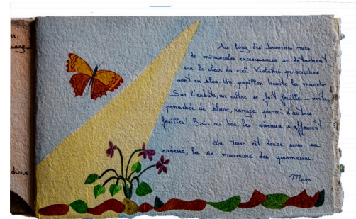
Page du livre d'artiste du "Journal de mon talus" avec une aquarelle de Claudine Goux (tous droits réservés)