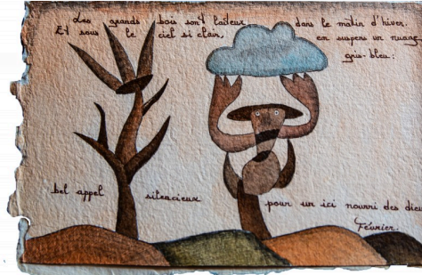
Page du livre d'artistedu "Journal de mon talus" avec une aquarelle de Claudine Goux (tous droits réservés)