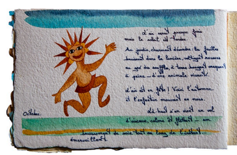
Page du livre d'artistedu "Journal de mon talus" avec une aquarelle de Claudine Goux (tous droits réservés)