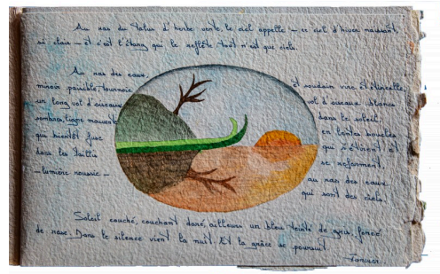
Page du livre d'artiste du "Journal de mon talus" avec une aquarelle de Claudine Goux (tous droits réservés)

Abonnement gratuit à demander à cette adresse : vignetfrancoise@gmail.com .