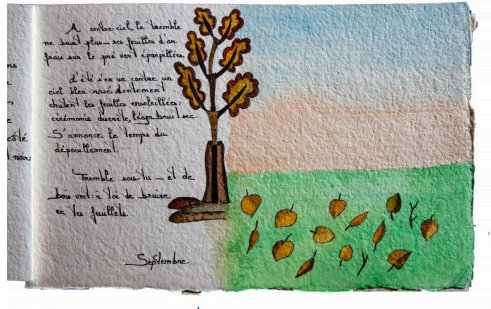
Page du livre d'artiste du "Journal de mon talus" avec une aquarelle de Claudine Goux (tous droits réservés)