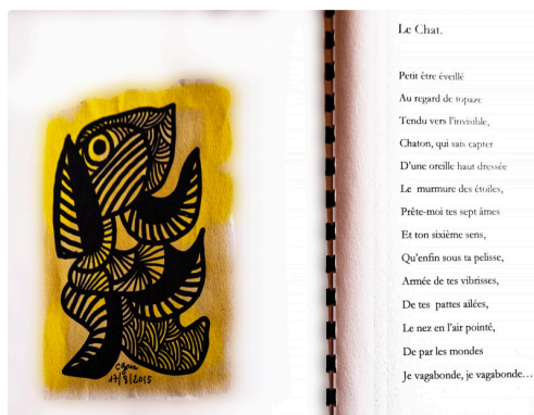
Le chat - Page du manuscrit du "Bestiaire"avec un dessin électronique de Claudine Goux (tous droits réservés)