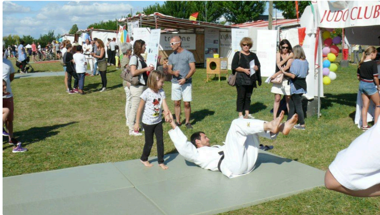
La 40ème foire aux sports et à la culture : un succès qui ne se dément pas

Le rideau est tombé sur la 40ème foire aux sports et de la culture qui s'est déroulée les 7 et 8 septembre, au parc d'Endoumingue. Quasiment une centaine de stands ont occupé le lieu, lesquels reçurent la visite d'environ 7.000 personnes venues découvrir les associations sportives, culturelles et les studios de danse.