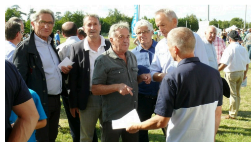
Les officiels sont allés à la rencontre des associations.