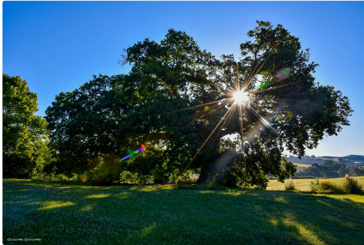
" L'Amour est dans le pré" recrute dans les mairies

.... et comme tout le monde le sait, on peut trouver son bonheur dans le Gers