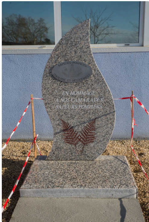
La stèle du CIS du Houga