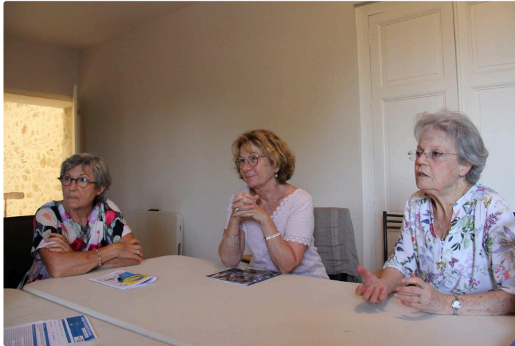
Une œuvre d'art contemporain installée définitivement au centre ville

Pour pouvoir la contempler, dans un avenir proche, il faut voter pour son projet au BDG 2