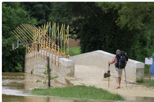
CAA Pont de Lartigue 2018 - Ci-dessus, dans le texte : CAA Espace St Michel Condom 2013

Par contre, il faut sélectionner un minimum de trois projets - six au maximum - pour pouvoir valider votre vote, et notamment celui qui nous intéresse dans le cadre de cet article, à savoir le Projet n° 1051.