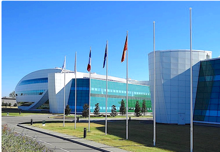
L'Oncopole de Toulouse veut monter en puissance