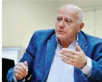
Le clin d'œil d'André Daguin

Tous les vendredis, vous avez rendez-vous avec André Daguin, figure emblématique des cultures et de la gastronomie gasconne. L'ancien chef étoilé, qui a rejoint le Cercle des Aficionados de PresseLib', prend sa plume pour vous.