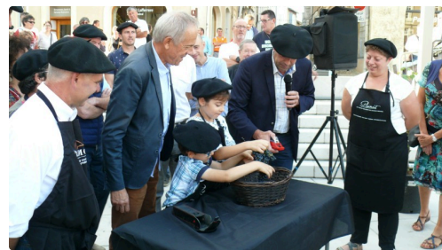
Les jeunes vigneron ont pressé du raisin pour en évaluer le degré.

« Aujourd'hui, il y a deux événements majeurs dans le monde, France-Argentine en rugby et, ici, les premières vendanges à l'escalier monumental. Le vin est un lien avec les pays lointains », relatait le sénateur Franck Montaugé.