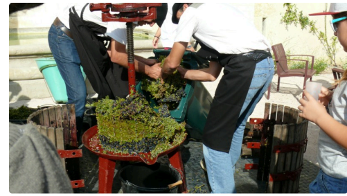
Les grappes ont été pressées.