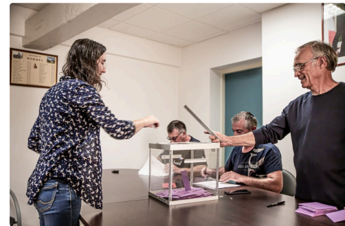
Une des dernières électorales