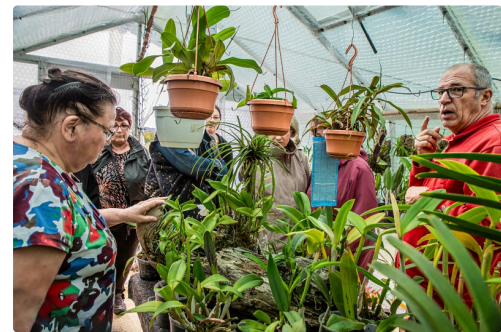
Les Papillons jaunes dans la serre