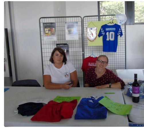
Le stand du foot et sa présidente