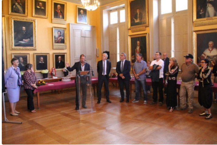
Remise des prix du Concours Communal des Maisons Fleuries

Le jeudi 3 octobre, à l'Hôtel de Ville, s'est déroulée la traditionnelle remise des prix du Concours Communal des Maisons Fleuries. En juin, le jury a pu apprécier les efforts de tous les participants pour faire d'Auch une ville agréable et fleurie.