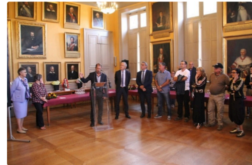
L'ensemble du jury, composé d'élus, de techniciens du service Environnement et d'horticulteurs locaux