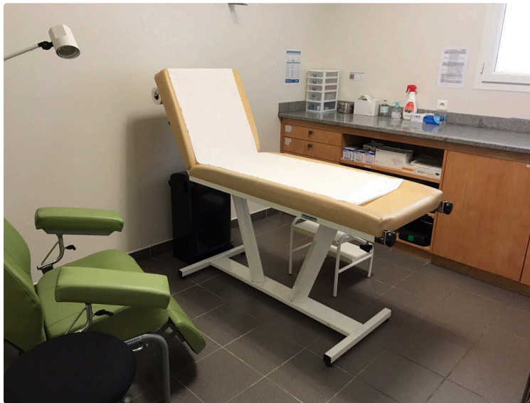
L'association Soins Santé Gers a ouvert un second centre dans le département

En pleine crise du milieu hospitalier, l'association Soins Santé Gers a ouvert, le 2 septembre dernier, une antenne à L'Isle-Jourdain, une réponse aux patients en recherche d'humain, autant que de soins.