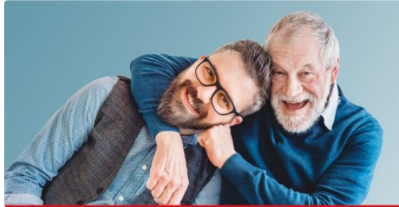
Le Salon des seniors met le cap sur l'emploi

Un job-dating pour les plus de 45 ans, à Pau