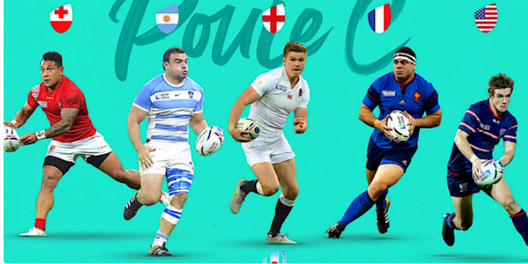
Coupe du monde de rugby

Les Japonais l'emportent encore à domicile : un exploit historique avec une victoire 28 à 21