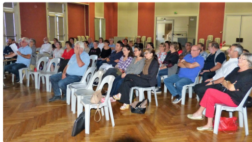
L'assistance très attentive.