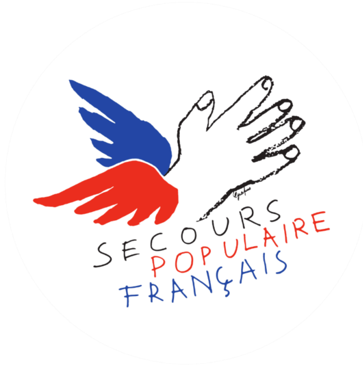
Congrès du secours populaire