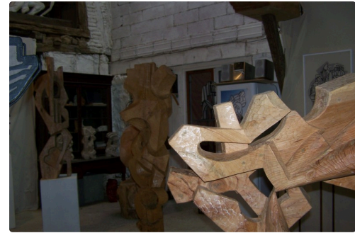
Exposition de ses œuvres dans l'atelier