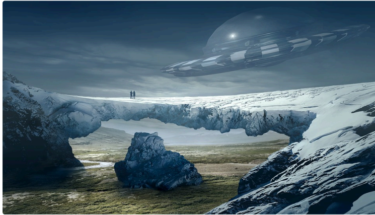
Bizarre, ce programme !

Et d'abord de quel bizarre s'agit-il ? Allez-vous savoir vous y retrouver ?