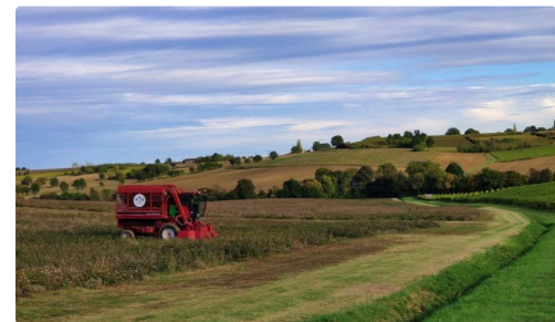
Drôle d'engin en terres gersoises