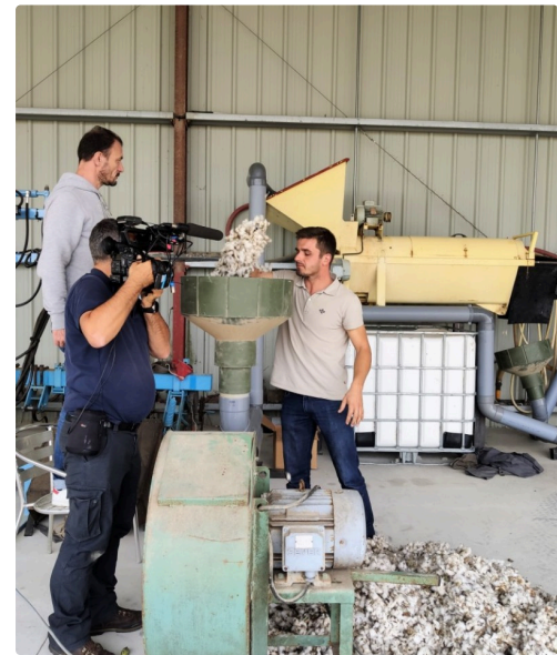
Démonstration à l'appui