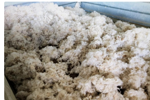
Le même coton, lavé et égrené