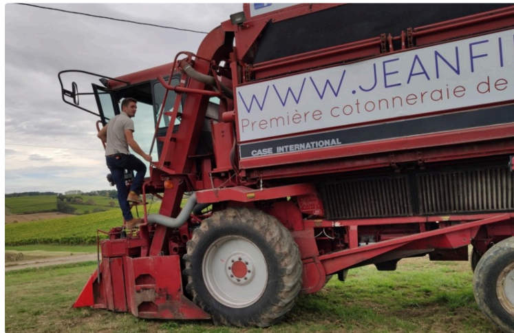
En route pour la récolte inédite de coton français !

À la SAS Jean Fil, première cotonneraie de l'Hexagone