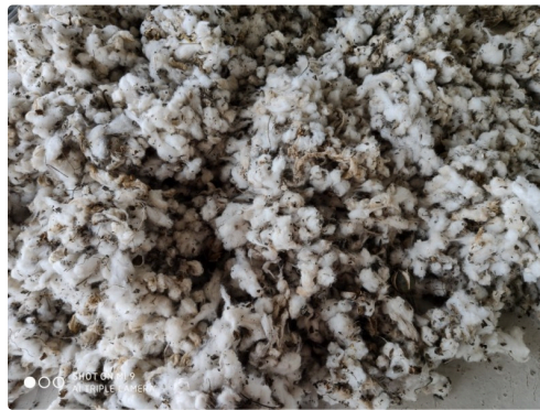
Le coton, récolté mais pas encore lavé