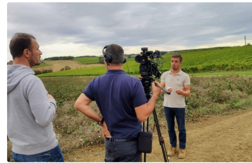
Sous les feux de l'actualité