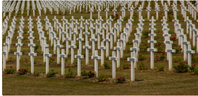
Le Souvenir Français mobilisé pour la conservation des tombes des soldats français morts pour la Nation

500.000 tombes de soldats morts pour la France risquent de disparaître dans nos cimetières communaux.