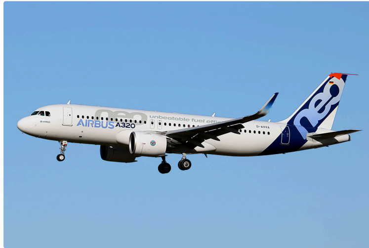
Airbus : décollage record vers l'Inde