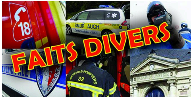
Ils mettent le feu au matelas et se retrouvent au commissariat