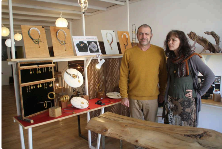
Le duo d'artistes d'Art et Trouvailles

Non loin des arènes, sur la place, un atelier-galerie vient de s'ouvrir. Cet écrin contient de véritables petits et grands trésors uniques allant des bijoux de création aux majestueuses tables en bois et autres objets en bois ou métal.