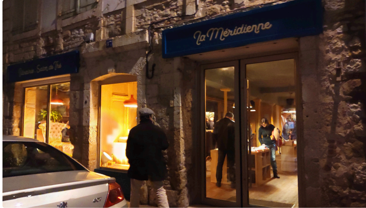
... Et de cinq !

Notre rubrique À vos marque-pages ! vient de s'étoffer et comptera, à partir du samedi 9 décembre, un nouveau contributeur.