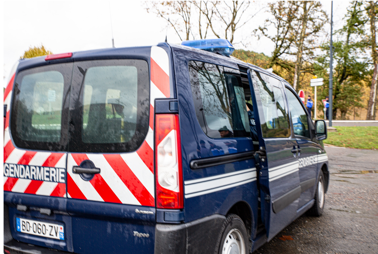
Opération de contrôle routier entre Beaumarchés et Marciac

Contre les infractions génératrices d'accidents graves