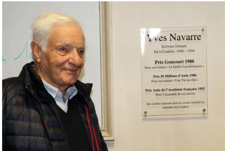
Yves Navarre en son pays

La médiathèque portant son nom a été inaugurée