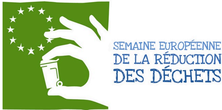
Une marche pour ramasser les déchets au Garros

À l'occasion de la Semaine européenne de réduction des déchets, du 16 au 24 novembre, Grand Auch Coeur de Gascogne participe à l'organisation d'une marche de ramassage des déchets, avec le Collectif des Marcheuses du Grand Garros et Zéro Waste.