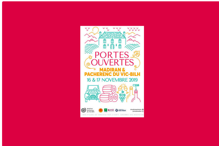
Aux Portes ouvertes Madiran-Pacherenc...

Dans le cadre des Journées Portes ouvertes de l'appellation Madiran-Pacherenc, qui ont lieu samedi 16 et dimanche 17 novembre, une exposition Art et Vin se tiendra au Château de Crouseilles, le dimanche 17 novembre, à partir de 10 heures. On sait que l'on y trouve aussi le meilleur des vins de Producteurs Plaimont, dont de beaux Madiran et de superbes Pacherenc du Vic-Bilh et d'autres encore.