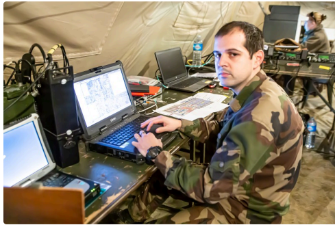
Opérateurs au travail à Gondrin