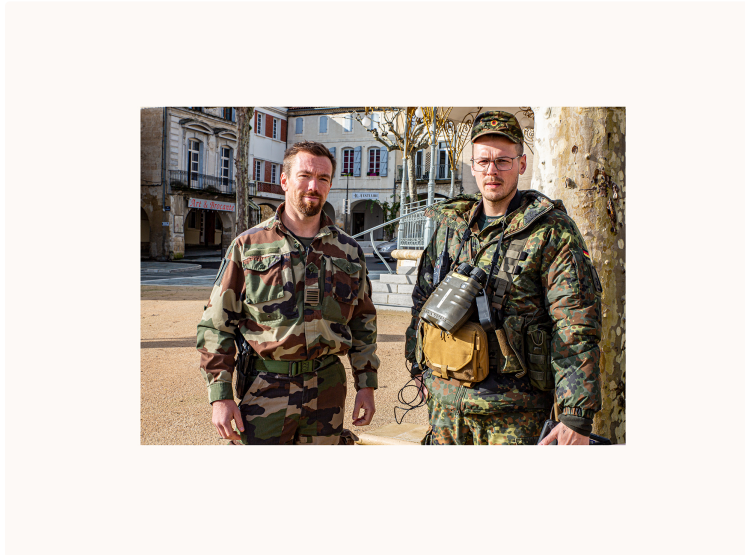
Appui aérien franco-allemand à Vic-Fezensac et à Gondrin

La base aérienne 133 Nancy-Ochey « Henry Jeandet » de l'Armée de l'air dispose d'un CFAA (Centre de formation à l'appui aérien [1]) qui organise, trois fois par an, des sessions de formation pour une vingtaine d'officiers et de sous-officiers des trois Armées, français et allemands (la Bundeswehr ne dispose pas de cette formation). Ils apprennent à guider les aéronefs.