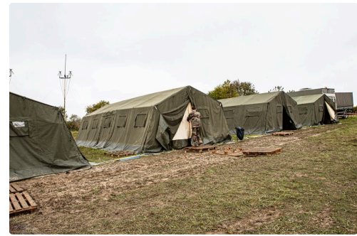
Le camp à Gondrin