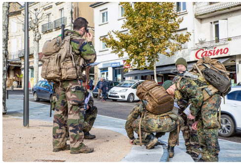
Stagiaires au travail à Vic-Fezensac