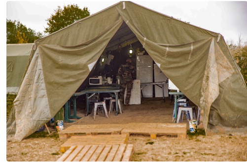
Intérieur d'une tente à Gondrin