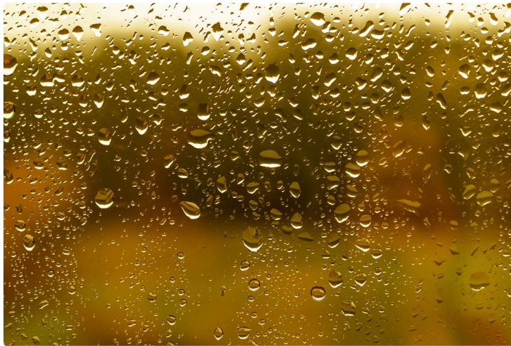
Le Gers en vigilance orange

Après les Landes et les Pyrénées-Atlantiques, le département du Gers est à son tour placé en vigilance orange aux pluies et inondations de 16 heures ce samedi à demain matin 6 heures.