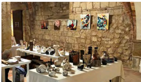
Lecture métiers bis.PNG