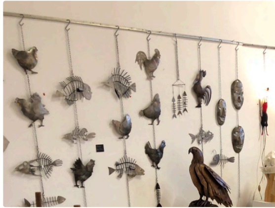
La 11e édition des Rencontres avec les Métiers d'Arts

L'invité d'honneur de ces rencontres est un sculpteur