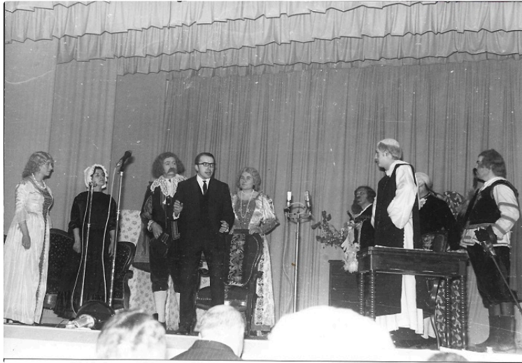
Le Comité Départemental de Théâtre amateur fête ses 30 ans

Exposition de photos du théâtre, à Mauvezin, de 1948 à 1991