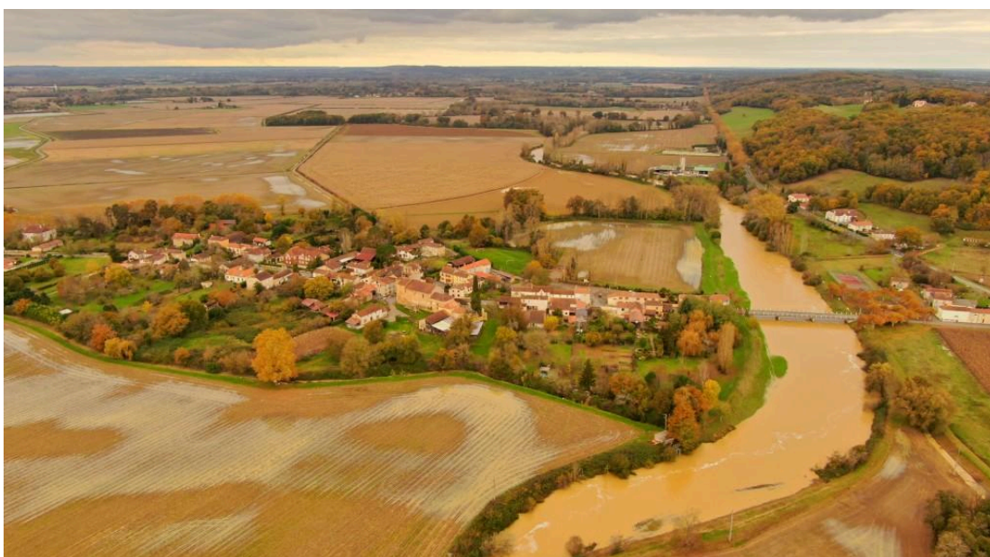
Tasque - L'eau s'amuse à dessiner sur les terres, mais elle déborde...