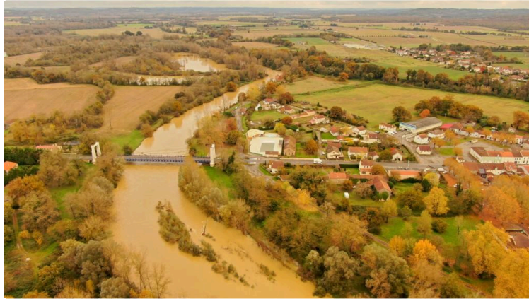
Les pieds dans l'eau...

Jaune, orange... les alertes météo aux pluies et inondations se sont succédé ce week-end sur les départements des Landes et du Gers, pour jouer un peu avec nos nerfs.