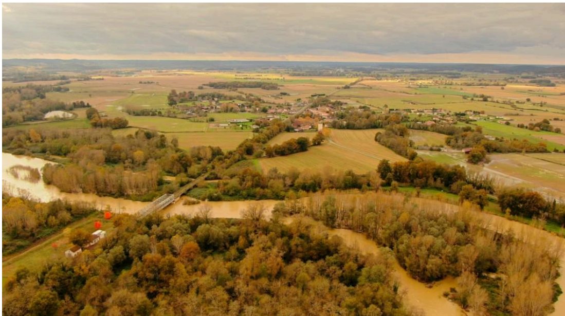
Tarsac toujours cet après-midi