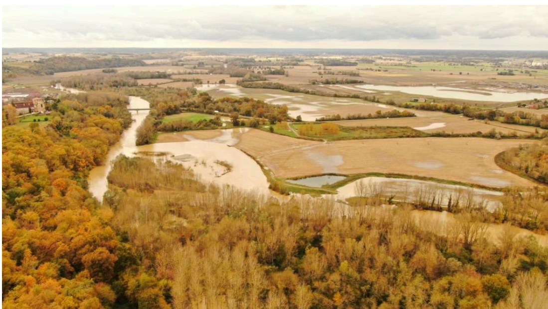
Saint-Mont semble ne plus avoir soif non plus...