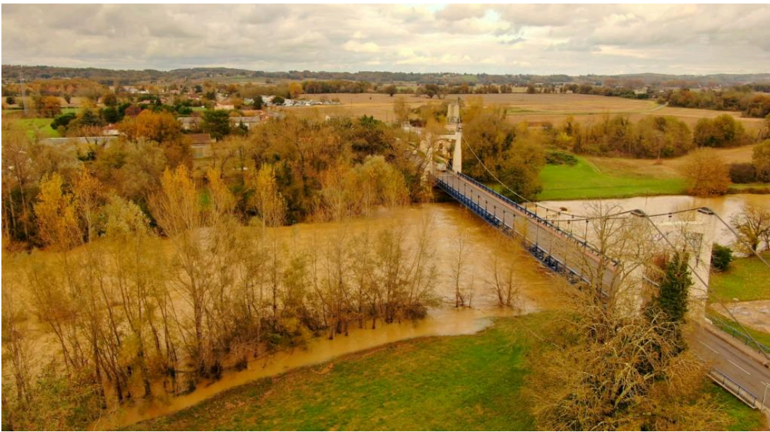
Riscle - Cet après-midi, vu du drone