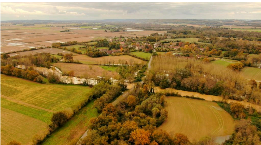
Izotges ©Laurent Lainé