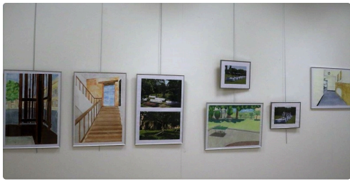
Un aperçu des travaux réalisés pour les 300 ans des bâtiments du lycée