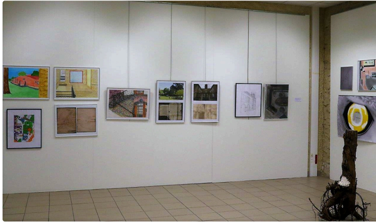
Vingt bougies pour l'association ART BOSS

L'association ART'BOSS a 20 ans et invite à son assemblée générale, le mardi 26 novembre 2019, à 18h, dans la salle de conférence du lycée.