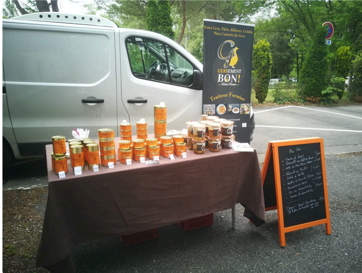
Festival de cane

La cérémonie du « Festival de Cane » a attribué les palmes récompensant les meilleurs producteurs dans la catégorie canard et oie, en attendant l'ouverture du salon Gasconh'à Table dès demain, à partir de 10 h 30 à la halle au gras de Samatan.