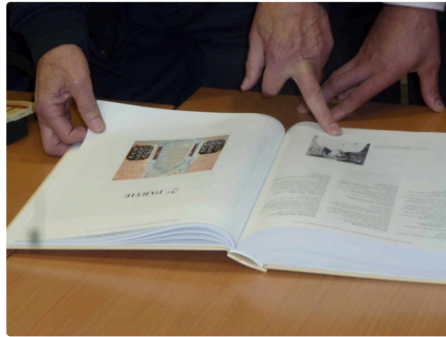
Un ouvrage plein d'anecdotes, ainsi une seule femme dont la photographie se trouve au bas de cette page, est recensée parmi tous ces morts.