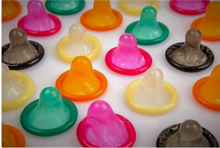
« Capote ta vie !!! » 52 établissements gersois y participent

Dimanche 1er décembre : Journée Mondiale de lutte contre le SIDA